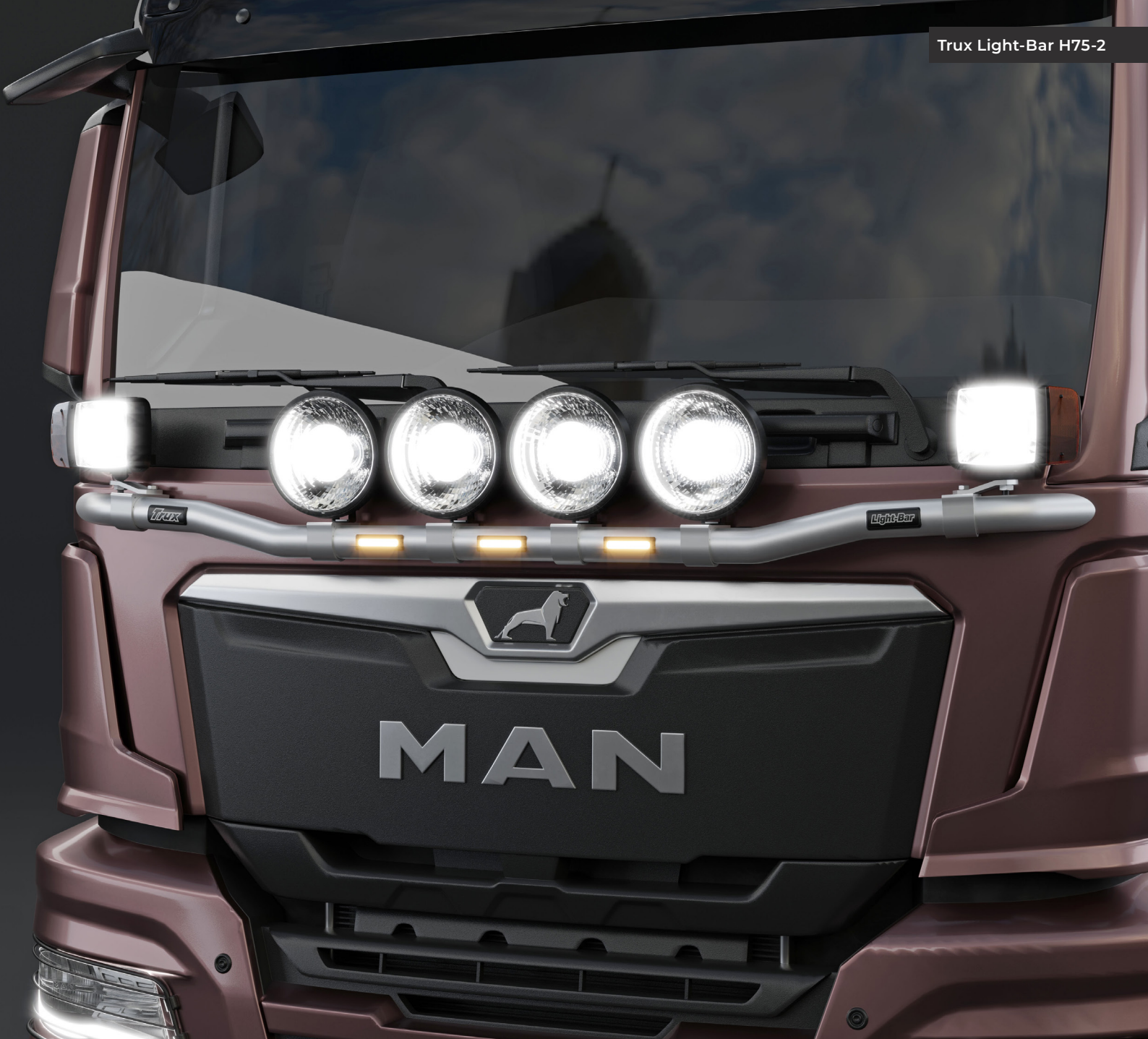
Trux Light-Bar H75-2