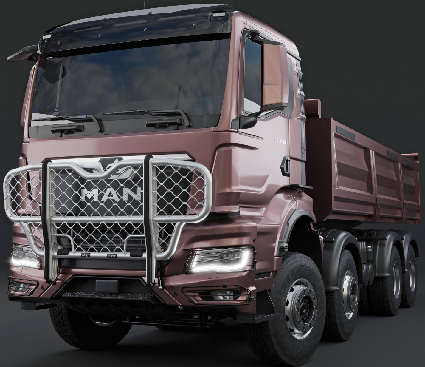
Trux Offroad B74-2