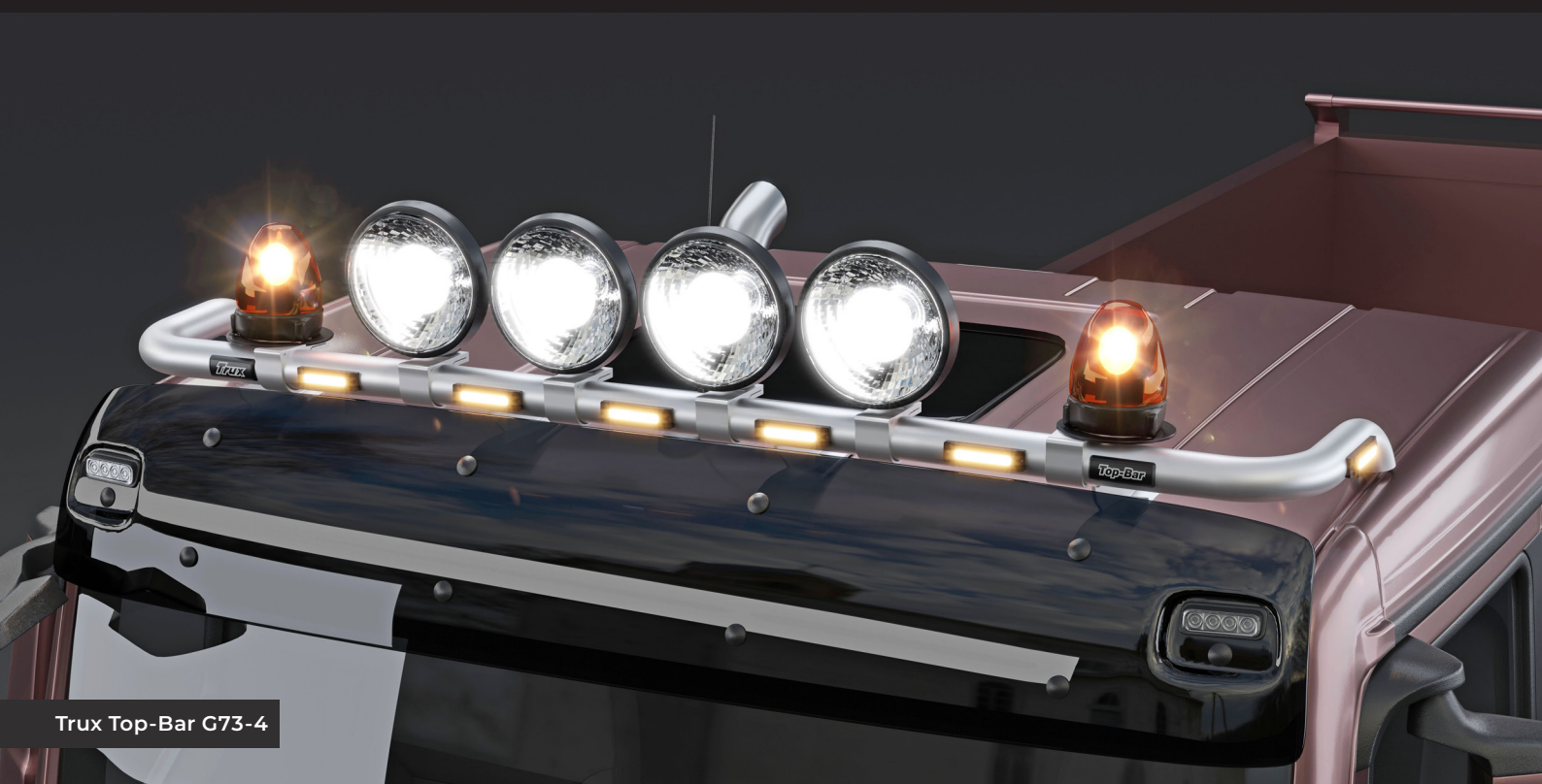
Trux Top-Bar G73-4