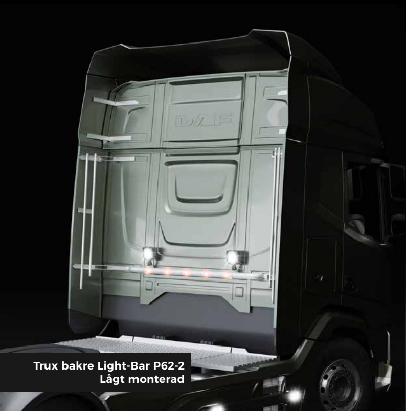
Trux bakre Light-Bar P62-2 Lågt monterad