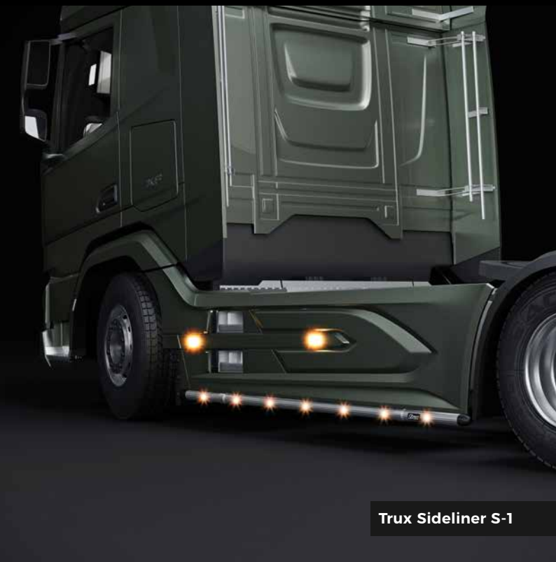
Trux Sideliner S-1