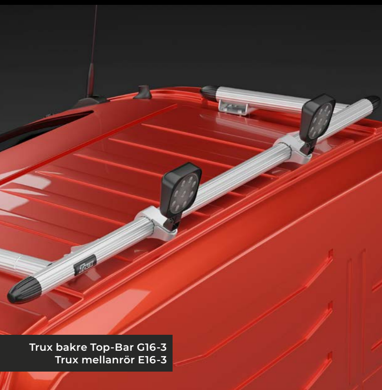
Trux bakre Top-Bar C16-3 Trux mellanrör E16-3