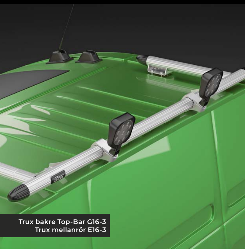
Trux bakre Top-Bar G16-3 Trux mellanrör E16-3