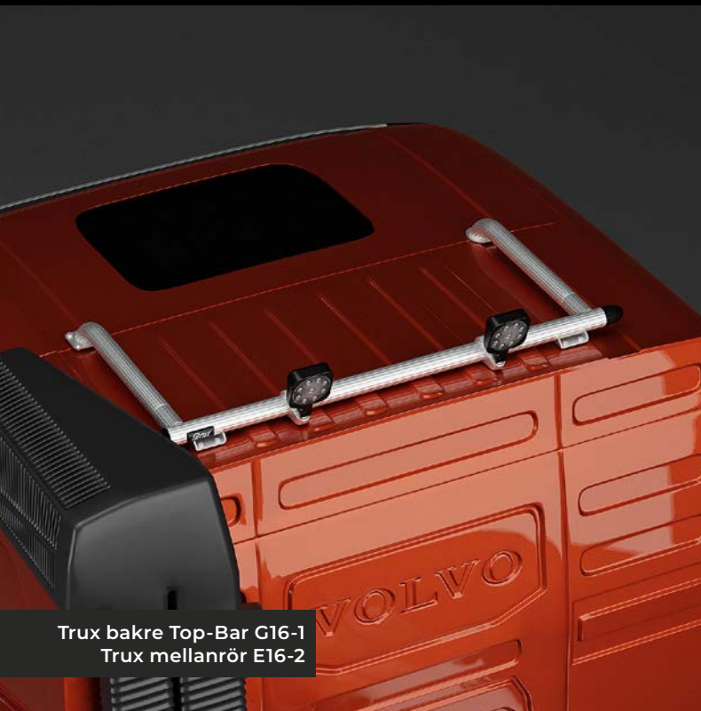
Trux bakre Top-Bar G16-1 Trux mellanrör E16-2