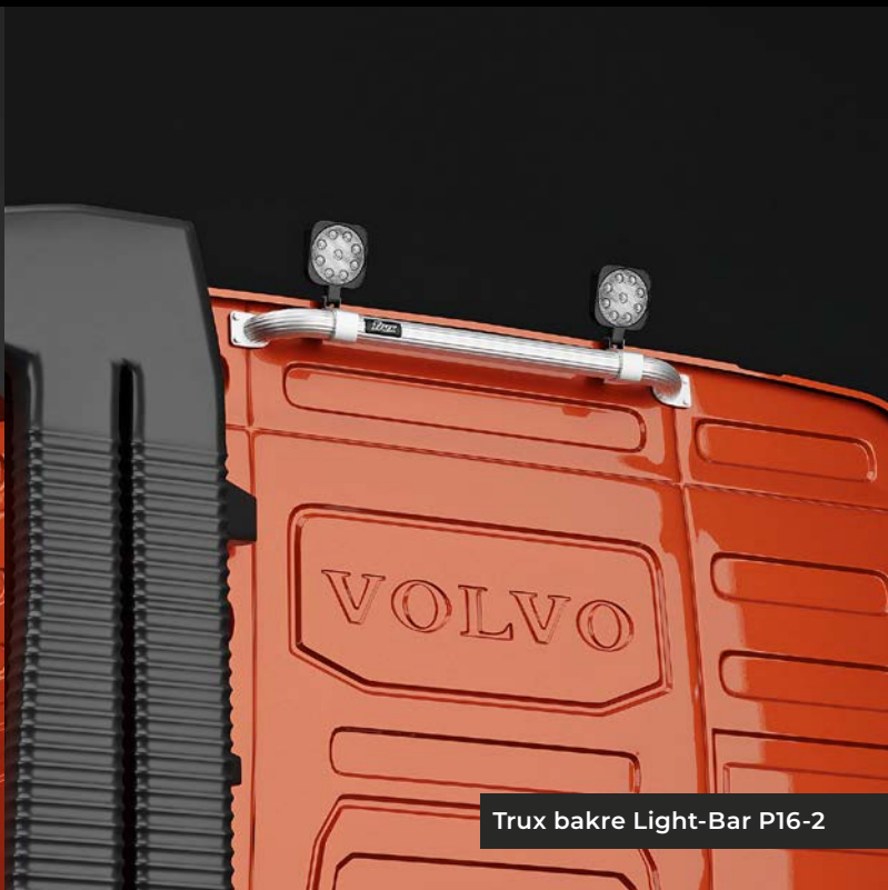
Trux bakre Light-Bar P16-2