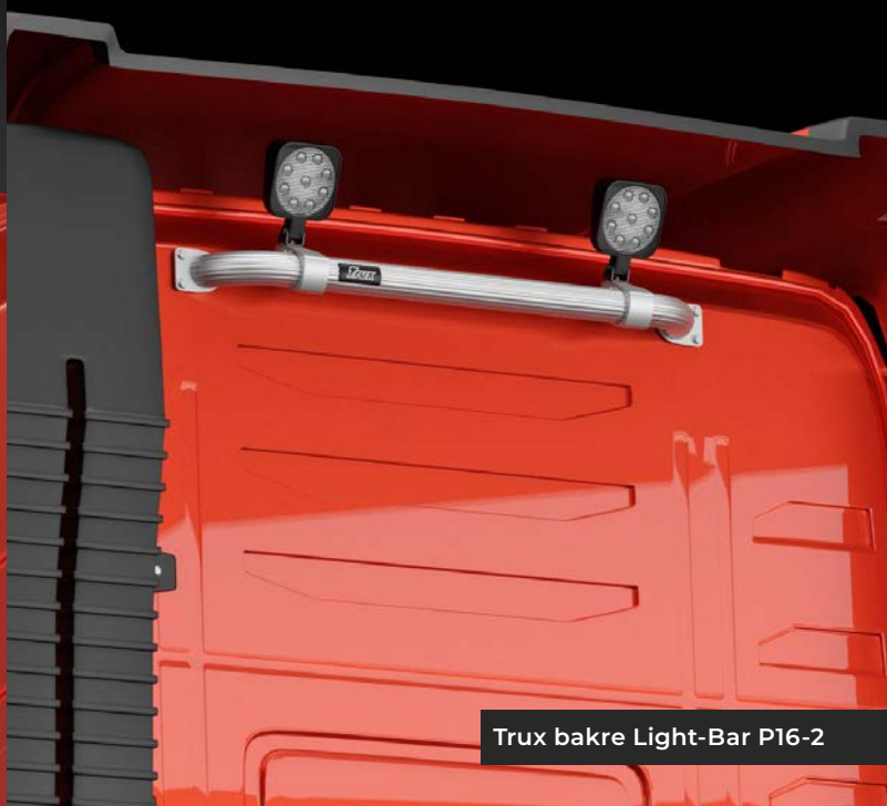
Trux bakre Light-Bar P16-2