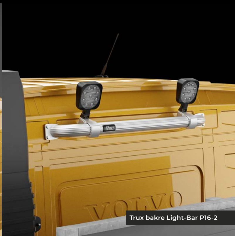
Trux bakre Light-Bar P16-2