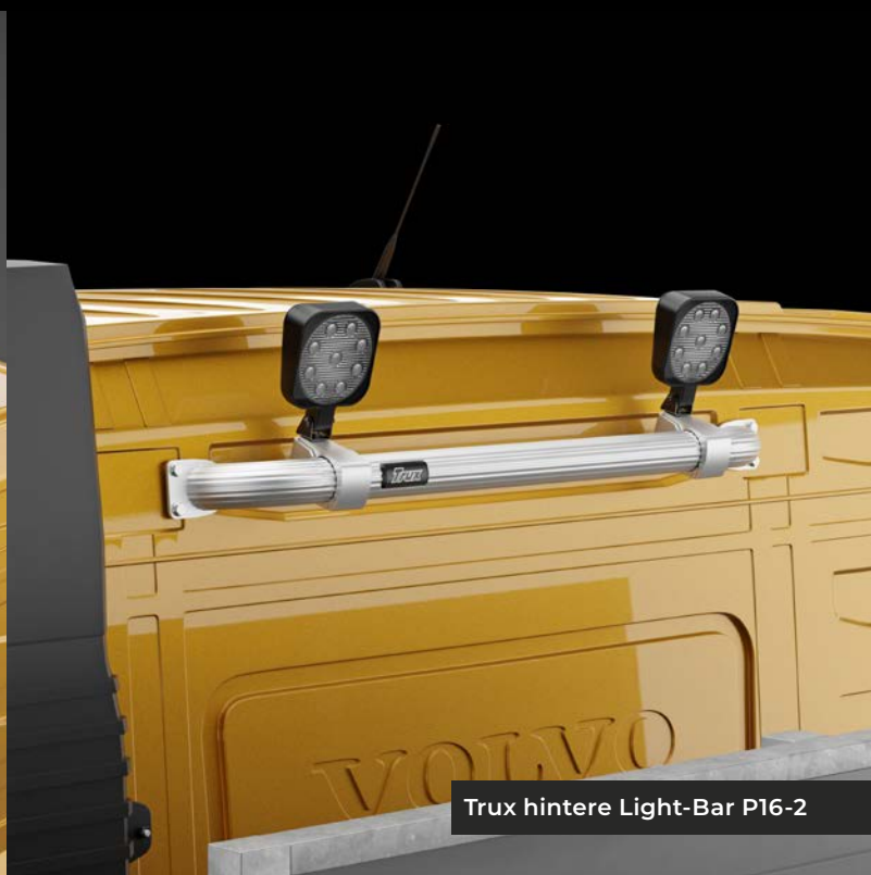
Trux hintere Light-Bar P16-2