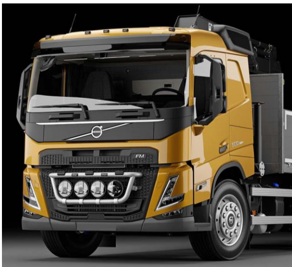
Lyktor ingår ej!