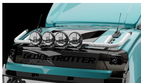
Lyktor och klämfästen ingår ej!