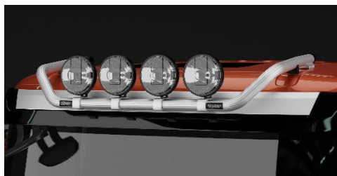
Lyktor och klämfästen ingår ej