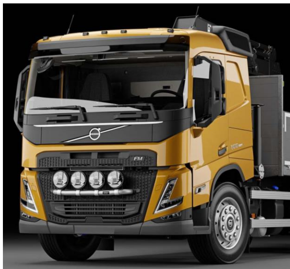
Lyktor och klämfästen ingår ej!