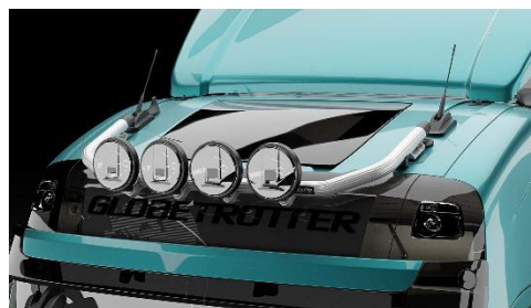
Lyktor och klämfästen ingår ej