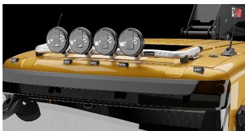
Lyktor och klämfästen ingår ej!